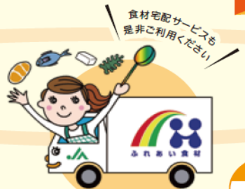
地域担当者(ふれあいさん)