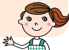
マスコットキャラクター：あいちゃん

JAふれあい食材では 見守りサービス が開始しました！ このサービスは、例えば独り暮らしをされているご高齢の方などを対象とし、 JAふれあい食材宅配員である「ふれあいさん」が直接『訪問』し、声掛け などの『会話』をし、依頼者の方へ安否などを『報告』するというものです。 JAだからできる地域ネットワークで皆様に安心をお届けします。 「すぐには会いに行けない。でも心配。」そんな不安を解決します！ 是非、お気軽にご相談ください。