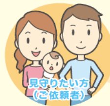
見守りたい方 (ご依頼者)